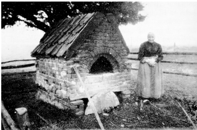
Bakoven in de buitenlucht

Zolang de eeuwige roggebouw bestaat, zijn heideplaggen of schadden bij de bemesting van het land gebruikt. In het najaar haalden de boeren het hun toekomstige aandeel aan plaggen