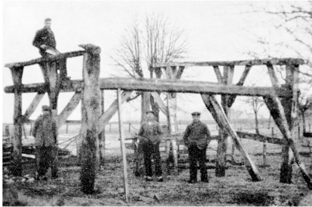
De basis voor de boerderij "het veerkante wark" wordt geplaatst

De zolder bestond uit ruwe planken of stammetjes, ook wel sleten genoemd. Midden boven de deel liet men tussen twee balken een rechthoekig gat open, "het slop" waardoor graan vanaf