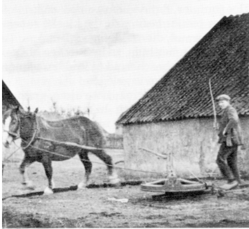
Het paard trok de rosmolen

De laatst bekende rosmolen in Stokkum was het ronde bakstenen “mölnhoes” dat bij de boerderij Effink stond en in 1975, toen de familie Kottenberg verhuisde naar het Vlier, werd afgebroken.