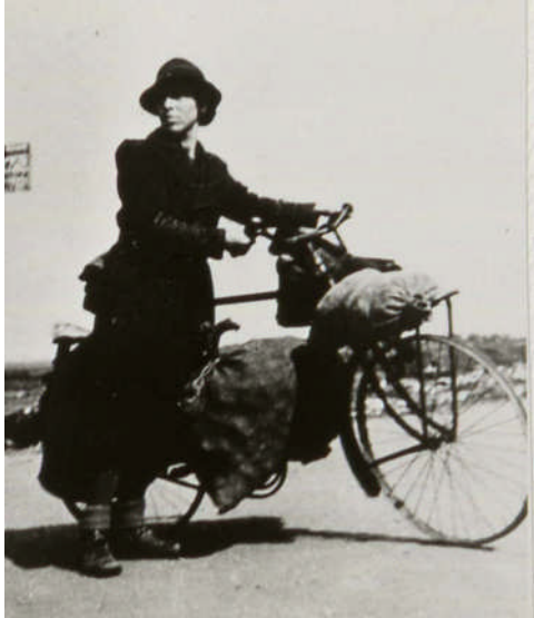
Ook etenshalers uit het Westen vonden onderdak in de zaal van Cafe Smit