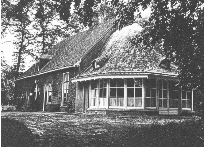
Boerderij Stoevelaar met de door Jannink aangebouwde herenkamer.

Men had, heel verstandig, gewacht met de verkoop totdat de gemeenschappelijke markegronden van de marke Herike in 1861 waren verdeeld. Hierdoor had men aanzienlijk meer grond te verkopen. De laatste bezittingen werden in 1866 van de hand gedaan. Daarmee was het grootgrondbezit van de Stoevelaar uit de Middeleeuwen, stapsgewijs en in kleine stukken, volledig overgegaan in particulier bezit.