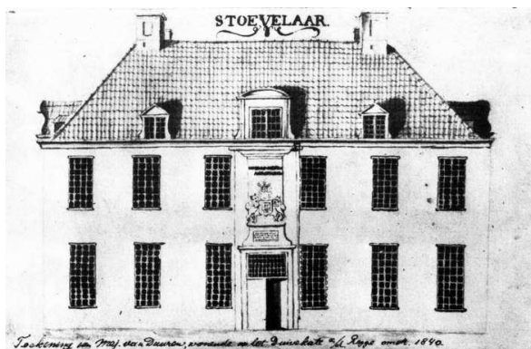
Het herenhuis dat ter vervanging van de havezate Stoevelaar werd gebouwd. Tekening van 1845.