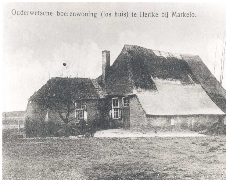
Het vroegere Plasman omstreeks 1920; "een lös hoës"