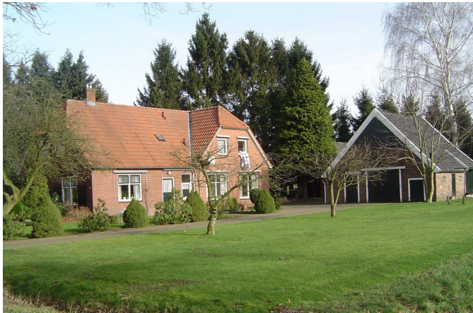
Het naar de Potdijk 16 verplaatste HaansJanHaarm