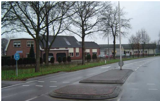
Huidige complex van de Fa. ten Brinke