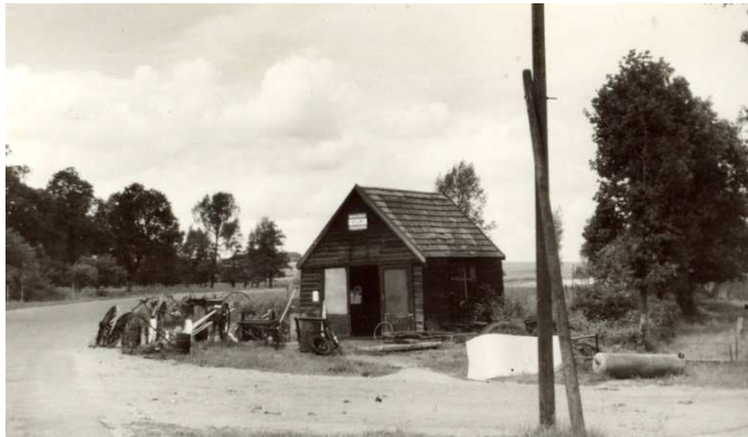
Het begin van de smederij

De grond waarop tegenwoordig het constructiebedrijf ten Brinke is gevestigd was vroeger grotendeels heidegrond behorend tot het gemeenschappelijk bezit van de marke Elsen. Bij de verdeling van deze gronden in 1854 werd het een onderdeel van de boerderij De Keujer (5.2.240). In 1926 werd op dit perceel, toen nog eigendom van De Keujer, een werkplaats gesticht. Het was een houten keet die aan de andere kant van de Plasdijk tegenover het pand, nu aangeduid met Plasdijk 2 (5.2.335) kwam te staan (dus t.o.v. het huidige constructiebedrijf aan de overkant van rotonde).