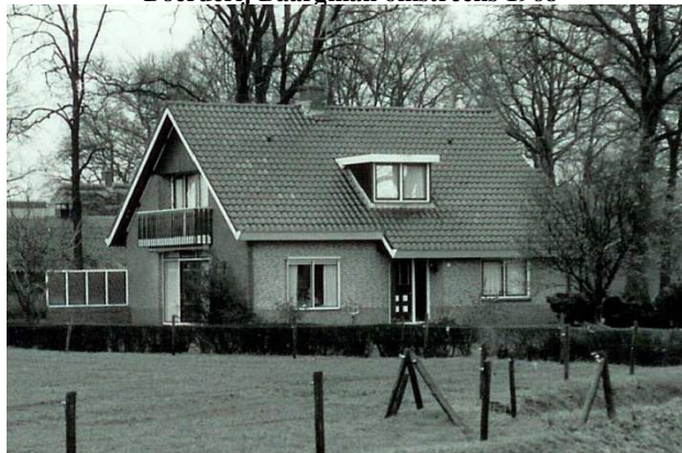
Woonhuis bij Baargman omstreeks 1995

De heropgerichte boerderij kreeg een omvang van ongeveer 16 ha.