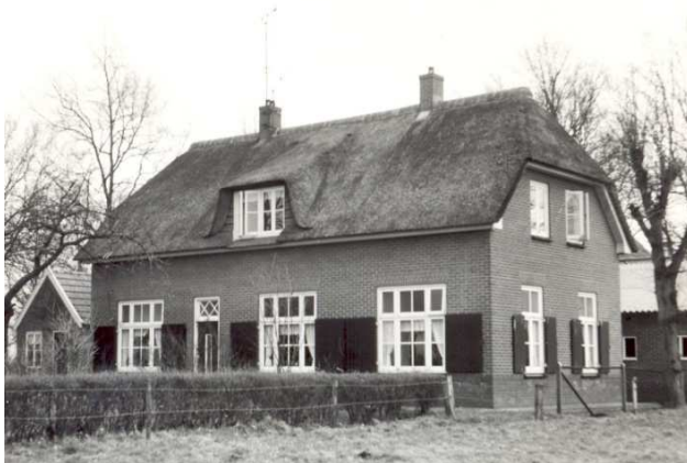
Boerderij Baargman omstreeks 1968