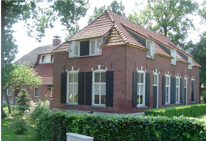
Boerderij Broeze in 2008