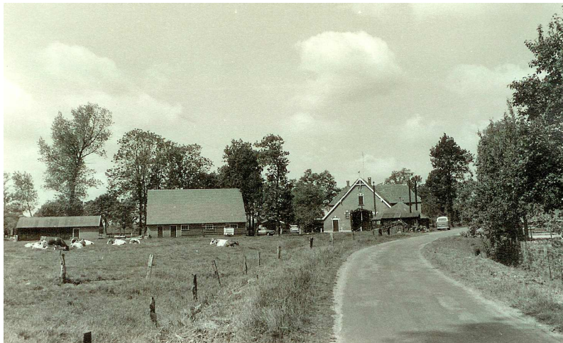
't Reef gezien vanaf het Elsenerbroek op de Scholendijk (1966)

De boerderij is lang eigendom gebleven van de families die eigenaar waren van de havezate Elsen.