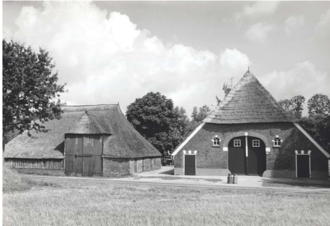
Boerderij Meulman omstreeks 1967