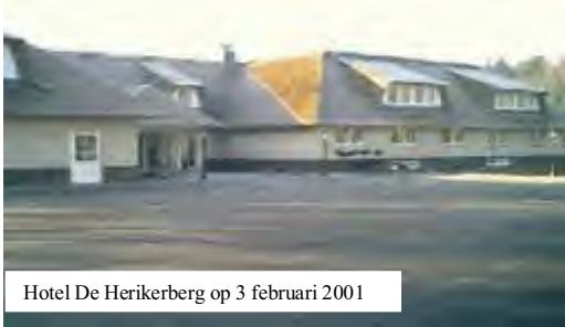
Hotel De Herikerberg op 3 februari 2001

Nadien bleven de restanten jarenlang een desolate indruk maken op de voorbijgangers.