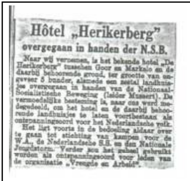
Uit: Hengelose Courant d.d. Maandag 25 november 1940