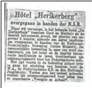
Uit: Hengelose Courant d.d. Maandag 25 november 1940