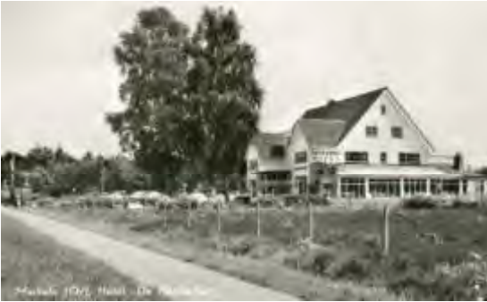
Hotel na 1950

De heer Boomkamp restaureerde het hotel grondig, waarna het op 15 juni 1950 werd heropend.