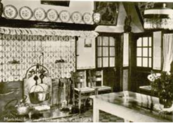
Haardvuur Cafe De Pot

waar de wortels uit elkaar gaan. Zo'n stuk is niet te klieven en werd dan ook in z'n geheel op het vuur gelegd, het leverde lange tijd warmte op. Er wordt vaak gezegd dat men zich aan hout drie keer kon warmen: een keer bij het kappen, dan bij het zagen en ten slotte bij het verbranden.