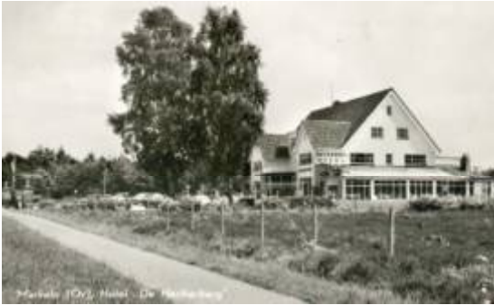
Hotel na 1950

Het hotel met een daar achterliggend huis werden gekocht door de heer Boomkamp. Deze kocht ook weer van de heer Jannink het heideveld ( in de volksmond nog steeds de netteveel'n genoemd, naar de visnetten die door de fa. Jannink in Goor werden gemaakt. Deze netten werden gedompeld in een bad met lijnolie en daarna te drogen gelegd op de heidevelden ). De heer Boomkamp restaureerde het hotel grondig, waarna het op 15 juni 1950 werd heropend.