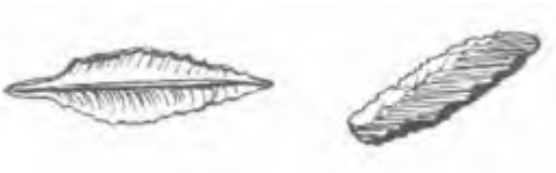
Vuursteen, gebruikt als pijlpunten en mesjes

vooral uit Limburg, België en Duitsland. Ze zijn door rivieren hierheen gebracht. Soms zitten daar mooie afgeronde vuursteen-tjes tussen, glad geslepen door het eeuwenlang rollen over elkaar, de bodem en over grote afstanden.