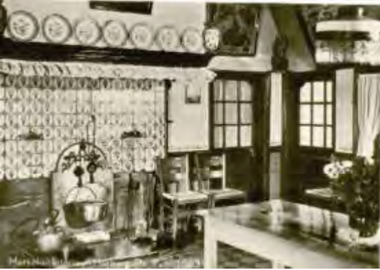
Haardvuur Cafe De Pot

waar de wortels uit elkaar gaan. Zo'n stuk is niet te klieven en werd dan ook in z'n geheel op het vuur gelegd, het leverde lange tijd warmte op. Er wordt vaak gezegd dat men zich aan hout drie keer kon warmen: een keer bij het kappen, dan bij het zagen en ten slotte bij het verbranden.