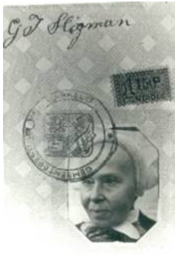
Voorbeeld van een Persoonsbewijs