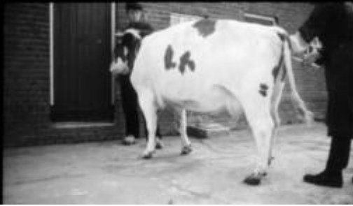
Kunstmatige inseminatie (de motorbolle in actie)