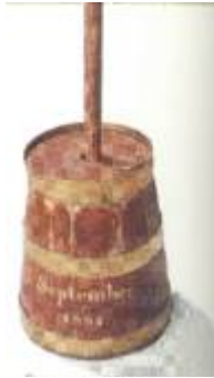
Het karnen in deze ton was een zwaar en vermoeiend karweikarwei.

Het karnen gebeurde meestal in de waskamer.