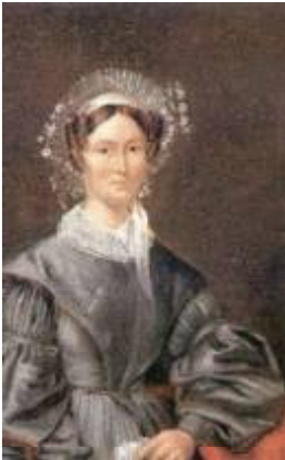
Periode 1800 – 1870 in Deventer Kleding van de gegoede burgerij. Zij draagt een grijze jurk met op haar hoofd een kapje.

Vaak was de kleding ook helemaal aan het beroep aangepast, zoals die van de Urkse en Volendamse mannen, die eeuwenlang vissers waren geweest waarvan de kleding voetvrij, warm, waterafstotend en winddicht was. Het verschil in welstand tussen Zeeland, Holland en Friesland aan de ene kant en Drenthe en Brabant anderzijds had ook gevolgen voor de kleding. In Drenthe en Brabant was kleding en versiering tot de eenvoudigste onderdelen beperkt.