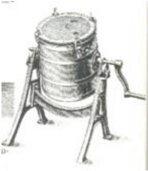
Ouderwetsse tuimelkarn die met handkracht werd aangedreven. Voorloper van de karn zoals die later in de zuivelfabrieken in gebruik was

In het lage deel naast de woonruimte lag als regel de waskamer, een open ruimte voor de reiniging en berging van vaatwerk. Die wasruimte was dus vlak bij de boavendure en daardoor ook dicht bij de put, die zich pal voor het huis bevond, zodat het benodigde water bij de hand was.