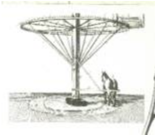
Paardekracht en tredmolen. Een combinatie om een karn, dorsmolen, etc. in beweging te zetten.

De waarde van de inhoud van beide kamers was dus ongeveer 25 gulden.