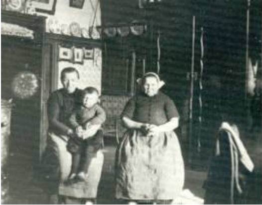
Werkkleding boerenvrouwen, periode 1900 - 1930

goedkoper stoffen te vervaardigen, zodat het mogelijk werd om meer met kleding te variëren.