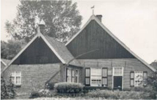
Erve Doesschot, een Weldammer boerderij

zes hoven, namelijk die van Ootmarsum, Oldenzaal, Borne, Delden, Weddehoen en Goor. In de 14 e eeuw waren in Kerspel nog 15 Bisschoppelijke erven, waaronder het Doesschot. De bewoners van deze erven waren horigen.