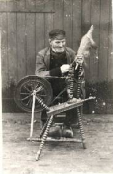
Koekgaait Aan het spinnen

Verdere werkzaamheden in januari waren spinnen en het maken van merklappen. Doordat er in de wintermaanden op de akkers niets te doen viel, hield men zich bezig met het zagen van het brandhout op de “zaaghond” en het kloven op de “holtpoer”.