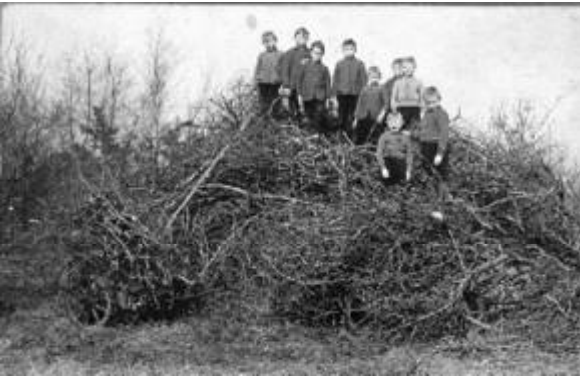
Het maken van een "boake" op de Dingspelerberg door jongens uit de Dijkkerhoek

Verzendekensdag in België, Narrentag in Duitsland, Allfoolsday in Engeland en Poisson d'Avril in Frankrijk. Uit de 80 jarige oorlog herinnert u zich nog wel dat we leerden: op de 1 e april, verloor Alva zijn Bril (Den Briel).