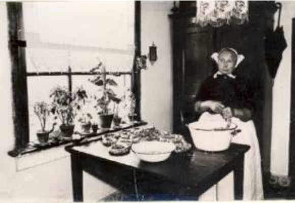
Worst maken met de hand.

Tegen de avond komt de huisslachter terug want het varken moet nu ingezouten worden in een grote kuip. Allereerst wordt de kop er afgesneden en even terzijde gelegd, evenals de reuzels. Vervolgens wordt de helft van het varken op een grote tafel gelegd en begint het afslachten. Bij het inzouten is het van belang dat de stukken spek in het midden van de kuip worden gestapeld. Tussen de stukken wordt zout gestrooid. De overige delen van het varken worden langs het spek gestapeld. Wij jongens staan we er bij het afslachten met onze neus bovenop. Tijdens het afslachten kunnen er namelijk twee muisjes tevoorschijn komen. Hoe de slachter dat precies doet weet ik nog steeds niet, maar op een gegeven moment horen wij een gepiep. Hij heeft een klein stukje vlees in zijn hand dat op een muis lijkt. Deze muisjes zijn voor mij en mijn broer. Bij het afslachten worden de afvalstukjes, zoals spek, vet en vlees in een teil gedaan om in de worst verwerkt te worden. Wanneer het varken