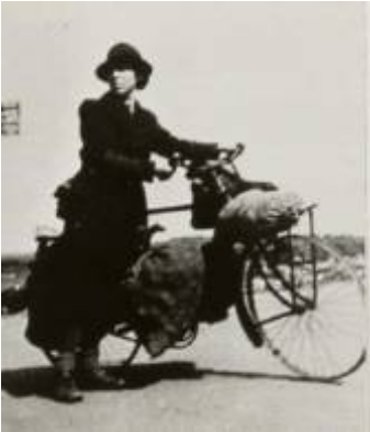
Ook etenshalers uit het Westen vonden onderdak in de zaal van Cafe Smit

De mensen die slechts kort bleven, de zogenaamde passanten, werden ondergebracht in zaal Smit (nu café het Wapen van Markelo). Degenen die langer bleven werden gehuisvest bij particulieren in het dorp en in de buurtschappen.