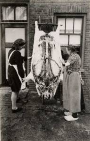
Het geslachte varken hangt op de ladder

schuur gehaald en deze onder het varken gezet. De slachter haalt nu de ingewanden eruit en deponceert ze in de wanne. De lever en de longen gaan in een aparte teil, want niets (behalve de dikke darm) mag verloren gaan. De blaas wordt er uitgesneden. Die is voor mijn broer en mij om hem op te blazen en te laten