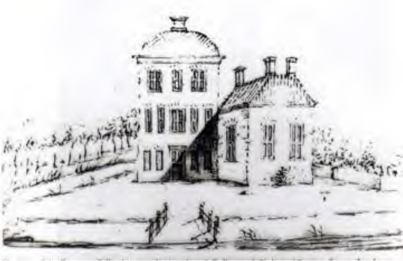
Huize Keppels ein 1700.

Over Huize Keppels is in het nummer van april 2004 het eerste deel geschreven. Om uw herinnering op te frissen of het vervolg