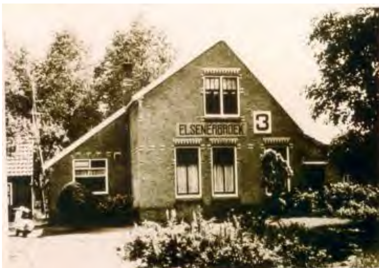
Station Elsenerbroek aan de spoorlijn Neede - Hellendoorn

Het taalgebruik van de koetsiers was meer mensen een doorn in het oog. Een dominee uit Delden, die met de postkoets naar Lingen wilde, maakte al voor het vertrek duidelijk, dat hij verwachtte dat de koetsier onderweg zijn woorden zorgvuldig zou kiezen. De voerman ging hierover niet in discussie, maar liet de verbouwereerde predikant staan waar hij stond. En dat terwijl de bagage van de dominee al was ingeladen.