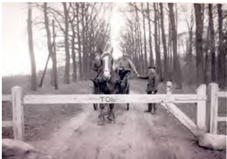
Tolheffing in het Westerflief. Tolboom en toltarieven zijn nu nog te zien.

Zo meldden in december 1814 drie van Deventer naar Bremen reizende vreemdelingen zich bij de burgemeester van Almelo.