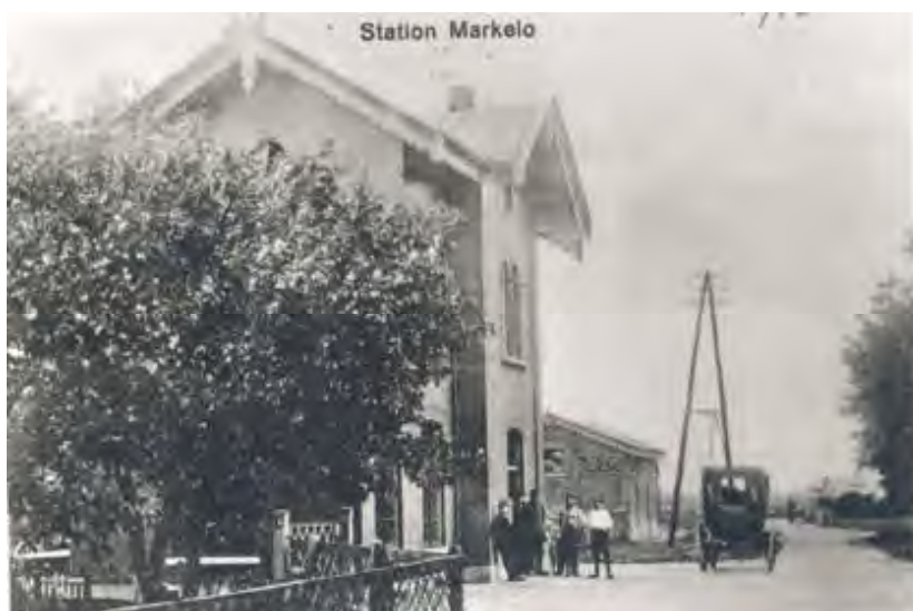
Station Markelo omstreeks 1910

Het vervoer over de weg werd dankzij de sporadische verhardingen ietwat comfortabeler, maar het hield nog steeds niet over.