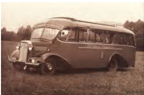
Eén van de eerste autobussen van de OAD; de Bedford uit 1938

Na verloop van tijd bleven er in deze omgeving, als gevolg van zware concurrentie, van de ongeveer zeven busondernemers 3 belangrijke over, nl. de TET (Twensche Electriche Trammaschappij), de TAD (Twensche Autobus Dienst) en de OAD (Oversijsssele Autobus Dienst).