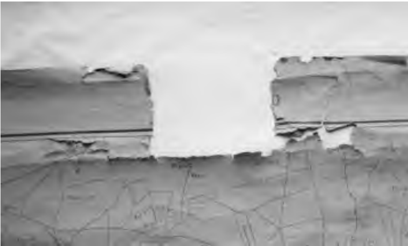
Bovenkant van de kaart, de O van Markelo is nog net leesbaar.

't Begon op een woensdagmiddag. Een telefoontje uit Middelburg, van een oud-collega: 'Hallo, met Co, hoe is het met jullie?' Na de gebruikelijke uitwisseling van informatie over het wel en wee van ieder, volgde dit gesprek: 'Ik heb iets voor jullie. Van iemand die mij goed kent kreeg ik een handgetekende plattegrond aangereikt. Hij weet dat ik gek ben op dat soort oude kaarten. Na wat speurwerk ontdekte ik de naam Markelo erop. Het blijkt een kaart te zijn waarop heel jullie woonplaats staat afgebeeld, uit 1924. Het is alleen jammer dat de bovenkant, omdat de kaart opgerold heeft gelegen en onbeschermd was, nogal beschadigd is.