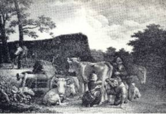
Melken, karnen en de boerderij schoonhouden waren de werkzaamheden van de boerin en of de dienstmeid. Dat het hierbij soms ook vrolijk toeging, laat ons een schilderij van Paulus Potter zien.

De techniek van handmelken was divers. Zoals alleen met duim en wijsvinger (het stripken) en/of met de volle hand. Het maakte niet uit als de melk maar in de emmer, die onder de uier werd geplaatst, kwam. Eerst ging men 'reiden' (anrieën), het licht masseren van de uier en de tepels. De koe liet dan de melk beter schieten. Dit had weer te maken met de hormoonhuishouding in het koeienlichaam en zo kon ze in korte tijd veel melk leveren. Als de emmer vol was (ook met vuil), werd de melk door een teems gegoten en opgeslagen in vleuten en vaten. (Een teems was een ronde, naar beneden taps toelopende bak, met onderin zeefjes waartussen een watje kon worden geplaatst om het vuil van de stal uit de melk te filteren). Het was helaas niet zo dat alle vuil dan uit de melk was, want het opgeloste vuil en de bacteriën werden niet verwijderd. De wat met de melkresten was een gewilde bijvoeding voor de katten op de boerderij. Helaas was het spijsverteringskanaal van een poes hierop niet berekend