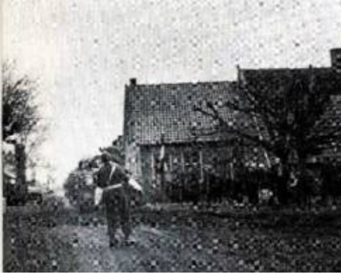
Canadezen bij het Weldam op weg naar Goor

fers. Deze worden per jeep naar een ziekenhuis in Nijmegen gebracht. Bij hun opmars naar Holten en Markelo, worden de Canadezen gehinderd door de Schipbeek. Besloten wordt om bij de Wippert en aan de Visschersdijk over te steken.