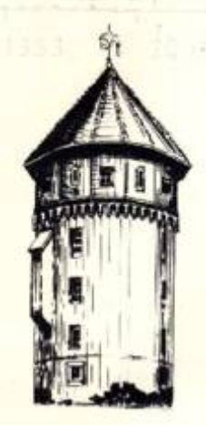
650 jaren oude toren van de Burcht Oeding

Rund ist die Welt und rund RdieserTurm er hat getruzet schon manlichem Sturm. An seinem Platze ein steinernes Haus- einst baute ein Ritter dem Feinde zum Graus.