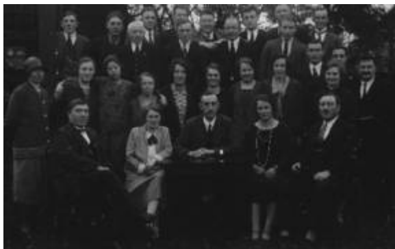
Groepsfoto uit 1935

De uitvoeringen en repetities werden gehouden bij ‘Tante Mina’ Leunk (café Het Wapen van Markelo), daar werden ook alle attributen opgeslagen inclusief het in eigen bezit zijnde toneel. Dat toneel moest voor elke opvoering opgebouwd worden door de eigen leden en daarna natuurlijk ook weer afgebroken. Er werd een keer besloten om dat toneel kosteloos beschikbaar te stellen voor andere Markelose activiteiten, b.v. voor scholen of een operette-uitvoering.