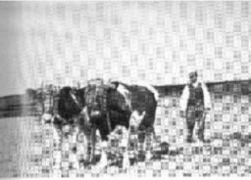
Eggen met ossen