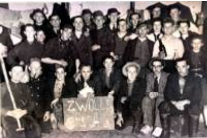
Opgepakt tijdens de razzia.

Er volgde een hongerwinter, met name in het Westen was dat heel erg. Er waren veel razzia's.