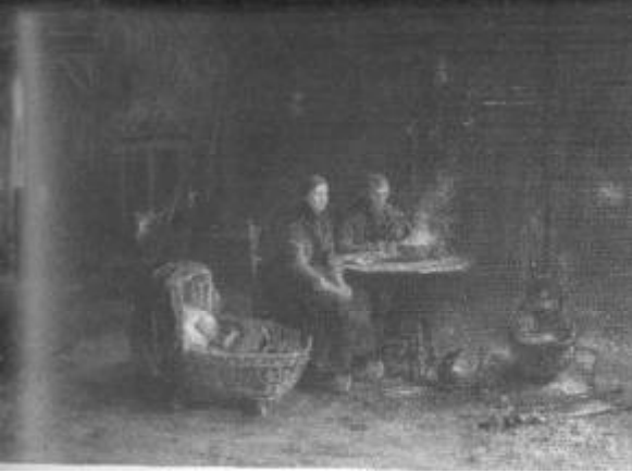
Dit interieur van een boerderij in Delden, geschilderd in 1885 door Jozef Israëls, laat ons zien hoe dicht mens en dier bij elkaar leefden in het l6s hoes.