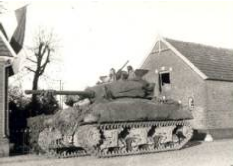
Poolse tank in het centrum, bij Hargeerds

De jongens van de Slagendijk hebben deze morgen een soort marathon op klompen gelopen, eerst naar de Schipbeek en daarna naar Markelo waar de Canadezen al zijn gearriveerd. Het centrum van Markelo wordt genaderd door Canadezen vanuit Laren terwijl een andere groep Canadezen via de Vischersdijk Markelo's grondgebied binnendringen. Deze groep gaat Stokkum en omgeving schoonvegen. In Stokkum worden een groot aantal Duitsers gevangen genomen waaronder een kindsoldaat van 12 jaar 4 .