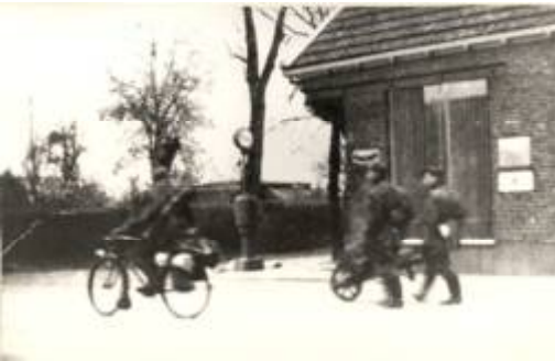
Laatste Duitsers vluchten uit Markelo