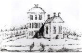
Huize Keppels eind 1700.