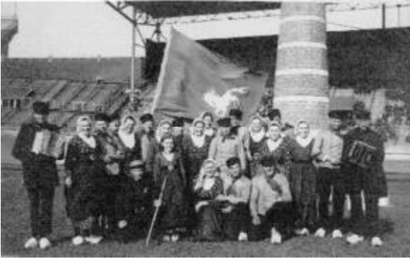
Markelose Boerendansers op klompen in 1945 op bevrijdingfeest in Amsterdam.

* De namen waar niets achter staat, zijn klompenmaker en landbouwer