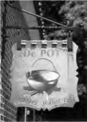
Het uithangbord of schild hangend aan de zijgevel van de herberg