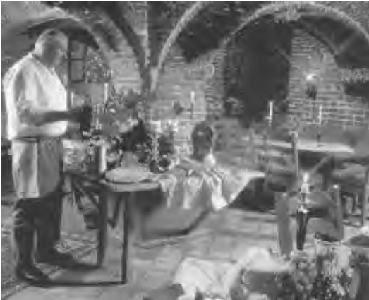
In de kelders van Odink is nu een restaurant gevestigd.

het delict “een privaten carcer te hebben gehouden” . Hij concludeerde tot veroordeling eener geldboete . De beklaagde wist alle mogelijk denkbare processuele zwariigheden op te werpen, zelfs de Munstersche Regeering, in wier gebied het delict was gepleegd bemoelijkte ten haaren behoeve den voortgang van het proces, doch ten slotte wees De Haagsche Bank der provincie Overijssel te Deventer op 22 Aug. 1780 (dus tien jaren na het delict) vonnis. Dit vonnis met advies bestaande 94 pagina’s druk, hield in o.a. de getuigenverklaringen der drie geïncarceerde Boeren, maar schenkt ons zeer weinig licht over de aanleiding en de omstandigheden der geheele geschiedenis; de beweegredenen der Vrouwe van Backenhage blijven ons ten een male onbekend, in het midden wordt gelaten of men hier te doen had met het gevolg eener plotseling opgekomen “boosaardige neiging” dan wel van een “gepraemiteerd voornemen”. Hoe het zij, het vonnis was niet malsch: de Vrouwe Beklaagde