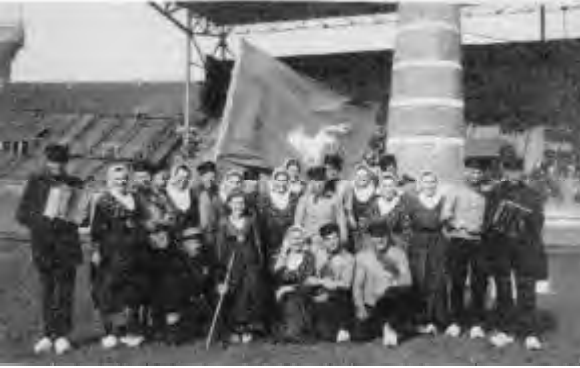
Markelose Boerendansers op klompen in 1945 op bevrijdingfeest in Amsterdam.

* De namen waar niets achter staat, zijn klompenmaker en landbouwer