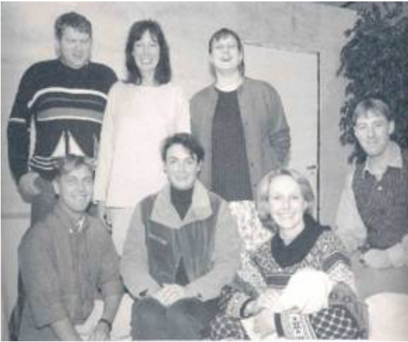
De spelers van de uitvoering in 1995.

De verslagen zijn zakelijk en professioneel geworden. Het is zeker de moeite waard om te vermelden dat Bilderdijk herhaaldelijk toneel heeft gespeeld voor de jeugd van Markelo, die opvoeringen werden zeer gewaardeerd. Op Sinterklaasfeesten werd er gespeeld voor de schooljeugd. Ook voor de ouderen trad Bilderdijk speciaal op, en het Rode Kruisbusje, voor de aanschaf daarvan had ook Bilderdijk een financiële bijdrage gegeven, goede dienst kon verlenen bij het halen en brengen van de bejaarden.