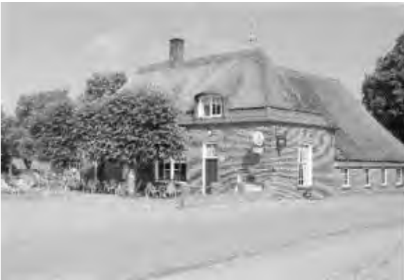
Herberg 'De Pot'

Deze herberg, dateert uit het jaar 1583 en ligt in de Pothoek aan de voet van de Herikerberg te Markelo. Jarenlang heerste er in deze herberg een echte landelijke sfeer. In de omringende boerenbehuizingen werden pauwen, eenden en ander gevogelte gehouden. De herberg werd bijna twee eeuwen bewoond door de familie's Scholten. Ze lag aan één van de bekendste postkoets-trajecten uit de geschiedenis, namelijk de zogenaamde heirweg. (Een heirweg is volgens Van Dale een weg die reeds door de Romeinse legers werd gebruikt. Omdat de Romeinen niet in deze streken gelegerd waren, is het woord heirweg misschien niet helemaal juist gebruikt). Het traject Deventer-Bremen voer vanuit Deventer via Bathmen, Holten, Markelo, Delden en Hengelo richting de grens naar het noorden van Duitsland. In Markelo ging het traject vanuit Holten via de huidige Postweg en Potdijk langs herberg 'De Poth', toen nog geschreven met de letter h op het eind.