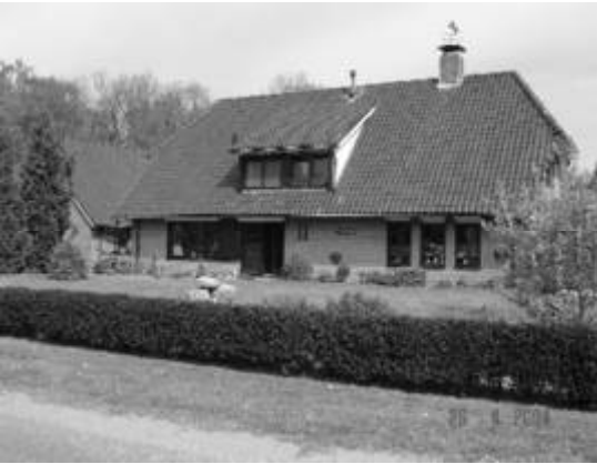
Nu en vroeger. Erve Traas aan de Traasweg