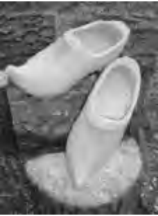
Zogenaamde tipklomp, werd hier vroeger gedragen door de vrouwen

Toch komt bij het maken van klompen veel vakmanschap te pas, een blok moet zodanig worden uitgehold dat een voet er keurig in past. Bovendien moet de linkerklomp precies het spiegelbeeld zijn van de rechterklomp. Natuurlijk speelt goed gereedschap daarbij een belangrijke rol. De klompenmaker onderhoudt zijn gereedschap dan ook zeer goed. Hij heeft aan al zijn beitels, boren en messen een naam gegeven. Per provincie of streek lopen deze benamingen sterk uiteen.