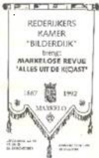
Programma's ontwerpen en stencillen werd door de leden zelf gedaan. Een manier om de kosten te drukken.

Dat jaar werd er voor het eerst gesproken over een geluidsinstallatie, de moderne techniek kwam een handje helpen.