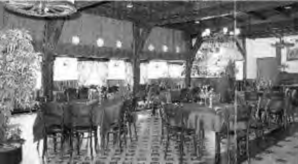
De sfeervolle delle ademt dezelfde gemoedelijke gastvrijheid uit als de onderstaande gelagkamer.

In de periode van de laatste Scholtens wordt het achterste gedeelte van het pand: de 'deel', verbouwd tot gastenverblijf, waar men ruimte vindt om een etentje te serveren of een klein feestje te geven.