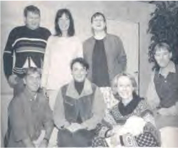
De spelers van de uitvoering in 1995.

De verslagen zijn zakelijk en professioneel geworden. Het is zeker de moeite waard om te vermelden dat Bilderdijk herhaaldelijk toneel heeft gespeeld voor de jeugd van Markelo, die opvoeringen werden zeer gewaardeerd. Op Sinterklaasfeesten werd er gespeeld voor de schooljeugd. Ook voor de ouderen trad Bilderdijk speciaal op, en het Rode Kruisbusje, voor de aanschaf daarvan had ook Bilderdijk een financiële bijdrage gegeven, goede dienst kon verlenen bij het halen en brengen van de bejaarden.