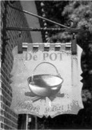
Het uithangbord of schild hangend aan de zijgevel van de herberg

Tot 1800 blijft deze naam aan 'de Poth' verbonden. De naam sterft hierna uit op de herberg, maar elders onder Markelo komt hij nu nog voor als Potman, maar nu zonder de letter h. In het jaar 1826 kwam de eerste 'Scholten' op 'de Pot' wonen. De duitstalige naam 'die Poth' werd veranderd in 'de Pot'. We schrijven het jaar 1836, toen de huidige herberg gedeeltelijk is herbouwd, blijkens de gevelsteen in het huis. Het oude pand is vermoedelijk zes jaar eerder door brand verwoest, als gevolg van het roosteren van vlas bij het open vuur, zoals toen veel gebeurde bij het maken van linnen. De herberg kon men herkennen aan een uithangbord of schild. Hierop stond en staat nu nog een pot boven het vuur geschilderd.