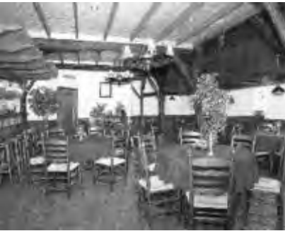
Het interieur van de Cosy-Inn