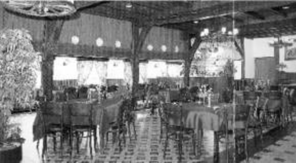
De sfeervolle delle ademt dezelfde gemoedelijke gastvrijheid uit als de onderstaande gelagkamer.

In de periode van de laatste Scholtens wordt het achterste gedeelte van het pand: de 'deel', verbouwd tot gastenverblijf, waar men ruimte vindt om een etentje te serveren of een klein feestje te geven.