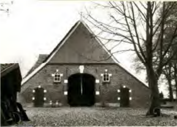
Achterzijde van erve Kolhoop