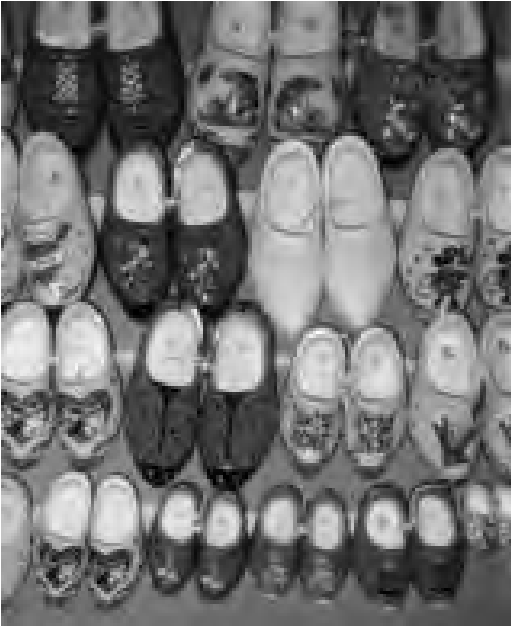
Klompen als souvenir

door talrijke folkloristische verenigingen die dansen op klompen. Zij zorgen ervoor dat de oude traditie van klompendansen in stand wordt gehouden. Vaak dragen zij klompen die met de hand gemaakt worden en passen bij de betreffende streek of dorp. Iedere klomp “spreekt” zijn eigen streektaal. De geschiedenis van de klomp is daarom een onderdeel van de Nederlandse culturele historie. 6