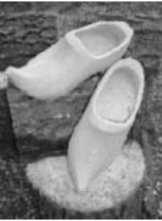
Zogenaamde tipklomp, werd hier vroeger gedragen door de vrouwen

Toch komt bij het maken van klompen veel vakmanschap te pas, een blok moet zodanig worden uitgehold dat een voet er keurig in past. Bovendien moet de linkerklomp precies het spiegelbeeld zijn van de rechterklomp. Natuurlijk speelt goed gereedschap daarbij een belangrijke rol. De klompenmaker onderhoudt zijn gereedschap dan ook zeer goed. Hij heeft aan al zijn beitels, boren en messen een naam gegeven. Per provincie of streek lopen deze benamingen sterk uiteen.