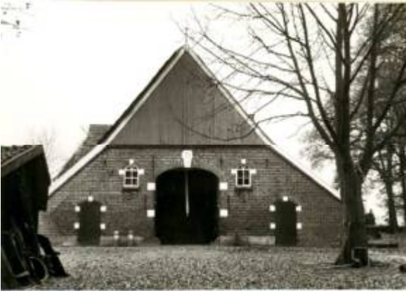
Achterzijde van erve Kolhoop