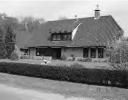
Nu en vroeger. Erve Traas aan de Traasweg