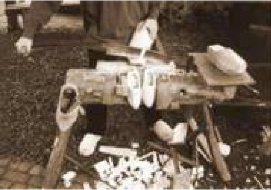
Een stuk hout wordt bewerkt tot klomp

In de volkstellingen van 1829 t/m 1900 vonden wij 47 personen die als nevenfunctie het beroep van klompenmaker uitoefenden. In bijgaande lijst hebben wij de namen van deze klompenmakers opgenomen.