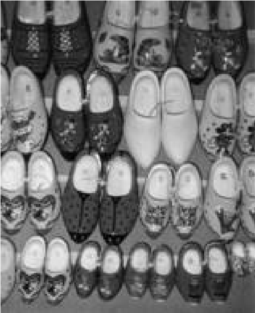
Klompen als souvenir

door talrijke folkloristische verenigingen die dansen op klompen. Zij zorgen ervoor dat de oude traditie van klompendansen in stand wordt gehouden. Vaak dragen zij klompen die met de hand gemaakt worden en passen bij de betreffende streek of dorp. Iedere klomp “spreekt” zijn eigen streektaal. De geschiedenis van de klomp is daarom een onderdeel van de Nederlandse culturele historie. 6