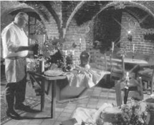
In de kelders van Odink is nu een restaurant gevestigd.

het delict “een privaten carcer te hebben gehouden” . Hij concludeerde tot veroordeling eener geldboete . De beklaagde wist alle mogelijk denkbare processuele zwariigheden op te werpen, zelfs de Munstersche Regeering, in wier gebied het delict was gepleegd bemoelijkte ten haaren behoeve den voortgang van het proces, doch ten slotte wees De Haagsche Bank der provincie Overijssel te Deventer op 22 Aug. 1780 (dus tien jaren na het delict) vonnis. Dit vonnis met advies bestaande 94 pagina’s druk, hield in o.a. de getuigenverklaringen der drie geïncarceerde Boeren, maar schenkt ons zeer weinig licht over de aanleiding en de omstandigheden der geheele geschiedenis; de beweegredenen der Vrouwe van Backenhage blijven ons ten een male onbekend, in het midden wordt gelaten of men hier te doen had met het gevolg eener plotseling opgekomen “boosaardige neiging” dan wel van een “gepraemiteerd voornemen”. Hoe het zij, het vonnis was niet malsch: de Vrouwe Beklaagde