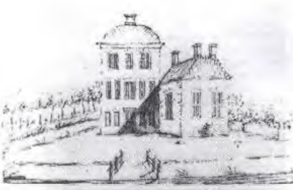
tekening van Huize Keppels