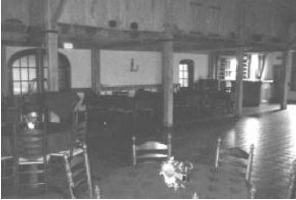
De nieuwe sfeervolle feestzaal.

Zo ziet men, sinds 1583 is er altijd bedrijvigheid geweest op 'de Pot'.