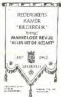
Programma's ontwerpen en stencillen werd door de leden zelf gedaan. Een manier om de kosten te drukken.

Dat jaar werd er voor het eerst gesproken over een geluidsinstallatie, de moderne techniek kwam een handje helpen.