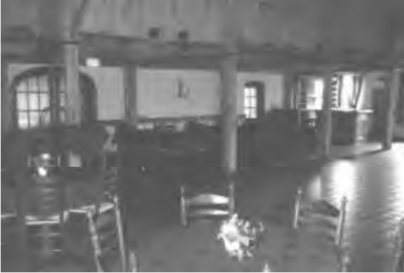
De nieuwe sfeervolle feestzaal.

Zo ziet men, sinds 1583 is er altijd bedrijvigheid geweest op 'de Pot'.