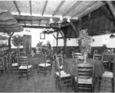
Het interieur van de Cosy-Inn