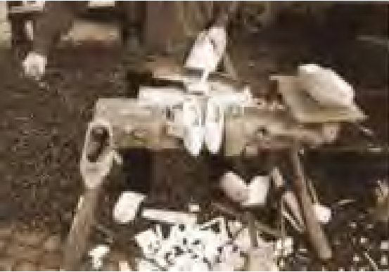
Een stuk hout wordt bewerkt tot klomp

In de volkstellingen van 1829 t/m 1900 vonden wij 47 personen die als nevenfunctie het beroep van klommenmaker uitoefenden. In bijgaande lijst hebben wij de namen van deze klommenmakers opgenomen.