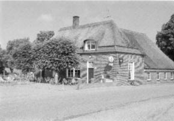
Herberg 'De Pot'

Deze herberg, dateert uit het jaar 1583 en ligt in de Pothoek aan de voet van de Herikerberg te Markelo. Jarenlang heerste er in deze herberg een echte landelijke sfeer. In de omringende boerenbehuizingen werden pauwen, eenden en ander gevogelte gehouden. De herberg werd bijna twee eeuwen bewoond door de familie's Scholten. Ze lag aan één van de bekendste postkoets-trajecten uit de geschiedenis, namelijk de zogenaamde heirweg. (Een heirweg is volgens Van Dale een weg die reeds door de Romeinse legers werd gebruikt. Omdat de Romeinen niet in deze streken gelegerd waren, is het woord heirweg misschien niet helemaal juist gebruikt). Het traject Deventer-Bremen voer vanuit Deventer via Bathmen, Holten, Markelo, Delden en Hengelo richting de grens naar het noorden van Duitsland. In Markelo ging het traject vanuit Holten via de huidige Postweg en Potdijk langs herberg 'De Poth', toen nog geschreven met de letter h op het eind.