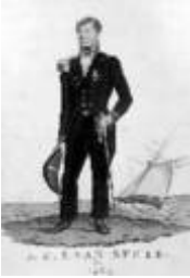
Luitenant Jan Carel van Speijk

Doordat de Hollanders ter plaatse al enkele vernederingen hadden moeten ondergaan, was van Speijk vastbesloten zich dergelijke beledigingen niet te laten welgevalen. Hij was ook de eerste die in oktober 1830 het vuur opende op Antwerpen. 4