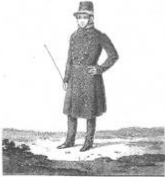
Uniform der kweekelingen 1841 – 1850

In 1818 gaf Koning Willem I opdracht een rapport uit te brengen wat leidde tot de oprichting van een veeartsenijschool. In 1821 werd op de verjaardag van de Prins van Oranje, 6 december, op de buitenplaats Gildesteijn, nabij Utrecht, de veeartsenijschool officieel geopend.