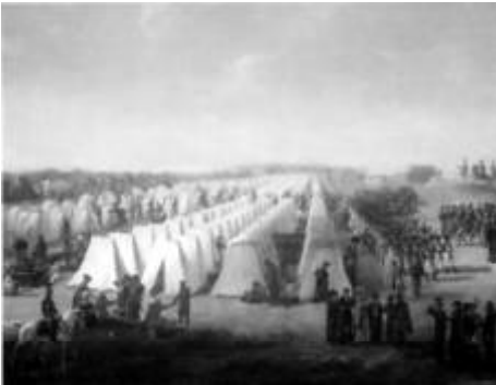
Legerkamp bij Rijen in Brabant

Op 1 augustus 1831 besloot Koning Willem I tot een gewapend optreden tegen België. De Tiendaagse veldtocht was begonnen.