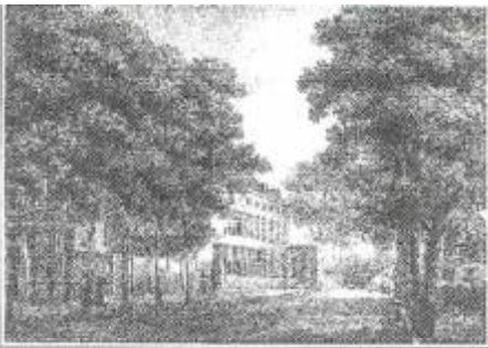
Rijksveeartsenijschool kort na de stichting, voorzijde

Op het einde van de 18 e eeuw was de behoefte aan geschoolde veeartsenijkundigen groot geworden, vooral door de steeds terugkerende uitbraken van ziekten zoals de veepest. In Frankrijk werden toen de eerste veeartsenijscholen opgericht. In Nederland bleef men de runderpest bestrijden door de verdachte dieren te doden, zoals dat tegenwoordig nog wordt toegepast bij varkenspest en vogelgriep. De boeren werden ook toen al uit een fonds schadeloos gesteld. Het was de Maatschappij ter Bevordering van de Landbouw die een prijsvraag uitschreef met als onderwerp: “de inrichting voor veeartsenijkundig onderwijs”. Winnaar werd J. Bennet uit Leiden. Hij kreeg hiervoor in 1798 een gouden medaille. Pas 21 jaar later verscheen dit ontwerp officieel. Dat het zolang duurde was het gevolg van een brand waarbij het manuscript ernstig beschadigd was geraakt. Als vestigingsplaats noemde hij Utrecht of Leiden. Zijn voorkeur ging naar Utrecht, daar werd de school later inderdaad gevestigd. Ook werden er pogingen ondernomen om in Zutphen een dergelijke school te stichten, dit liep echter op niets uit.