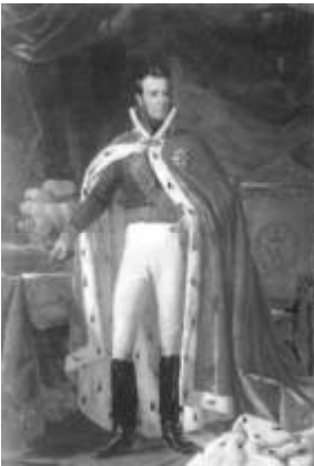
Koning Willem I

Het Wener Congres besluit in 1815 de Noordelijke en Zuidelijke Nederlanden te verenigen om tegenwicht te bieden aan het zojuist getemde Frankrijk. Een samenvoeging die de Belgen werd opgedrongen en ook niet gebaseerd was op de wens der Nederlanders. Deze geschillen en de bestaande onderlinge tegenstellingen op allerlei gebied gingen steeds scherpere vormen aannemen. Het zuiden (België), dat nog voornamelijk katholiek was, zag de calvinisten uit het noorden nog steeds als ketters. Willem I die zichzelf zag als een verlicht despoot botste steeds vaker op verbitterde tegenstand, vooral toen hij zich ging bemoeien met de katholieke priesteropleidingen en de invoering van de Nederlandse taal in Vlaanderen. Bovendien werden de Staatsschulden van beide landen samengevoegd, waarbij de schulden van het noorden veel groter waren. De onvrede in België uitte zich steeds meer in opstootjes en straatrellen. De reacties van de regering hierop waren te mild en toegevend. Door dit optreden was te verwachten dat het hier en daar tot oproer zou komen, hetgeen inderdaad op 25 augustus 1830 te Brussel het geval was.