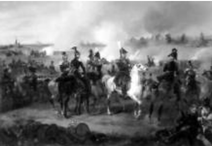
Slag bij Leuven

Door het oprukken van het leger naar Leuven werd de situatie voor de Belgen zo hachelijk dat de nieuwe Koning Leopold I op 10 augustus om 2 uur besloot de hulp van het Franse leger in te roepen. Op 11 augustus werden in Brussel de Franse troepen zeer enthousiast ontvangen, terwijl de Nederlandse troepen voor de poorten van Leuven stonden. Door de grote mogendheden en door de druk van de Franse troepen werd een wapenstilstand bereikt. Wel kon Prins Willem, als surrogaat van zijn verovering van Brussel, een triomfantelijke intocht in Leuven houden. Op 14 augustus aanvaardde het Nederlandse leger de terugtocht en werd gelegerd in Brabant.