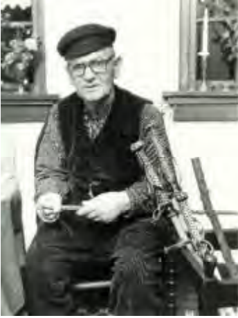
Kleinzoon Herman zet uiteindelijk de traditie voort.

van de veertjes en met een mes worden gespleten. Tussen de ganzenpennen door wordt er gevlochten met ca. 25 paardenharen, afkomstig van de staart. Het paardenhaar kan pas gebruikt worden als het eerst, om het te ontdoen van vuil en vetigheid, uitgekookt is. Als laatste wordt de stok opgeschuurd en ingewreven met bijenwas.