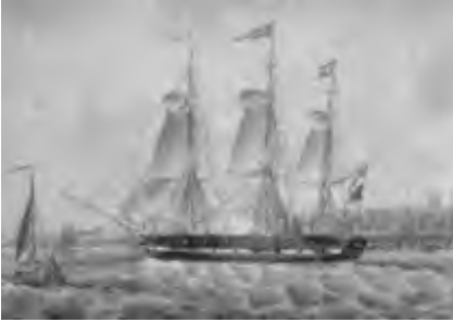
1846 De Johanna Cornelia is net vertrokken van de Boompjes te Rotterdam volgepakt met emigranten naar uiteindelijk o.m. Michigan

hun synoden kwam het echter tot veel onderlinge verdeeldheid. Scholte, die in conflict met De Cock was geraakt, en Van Raalte emigreerden in de jaren veertig naar de Verenigde Staten met veel aanhangers, die voegden zich daar bij de Reformed Church of vormden na 1857 de Christian Reformed Church.