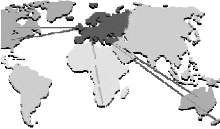
Lijnen naar de emigratielanden.

plukken. Vaak vormen de emigranten samen hun eigen gemeenschappen binnen het nieuwe land, ook om nieuwkomers te helpen met de integratie.