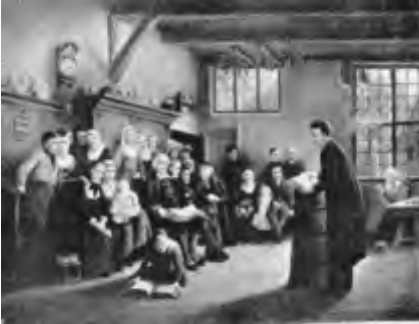
Een afgescheiden dominee preekt illegaal in een keuken van een boerderij