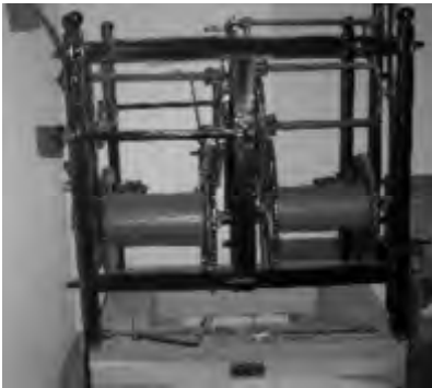
Deze klok staat onder in de toren van de Martinuskerk te Markelo