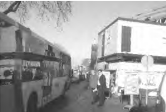
Donderdagmorgen, 7 februari 2008, om 10.00 uur Het verkeer wringt zich weer door de Grotestraat.

Markelo zal pas echt goed op de kaart staan als over 10 jaar de soapserie "De lijdensweg van een rondweg" haar 75-jarig jubileum viert.