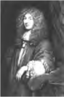
Christiaan Huygens, door Caspar Netscher, 1671 Museum Boerhave Leiden

In Markelo werd nog heel lang de tijd 's avonds en 's nachts door de nachtwaker omgeroepen. Pas in 1911 werd de functie van nachtwaker afgeschaft.