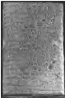
Een kleitablet met spijkerschrift

vogeltrek, het groen worden van bomen en struiken en het langzaam toe- of afnemen van het dagelijkse zonlicht. Zo ontstonden primitieve jaarkalenders, die het verloop van de tijd aangaven. Langzamerhand kregen de mensen behoefte aan een onderverdeling van die perioden van het jaar. Daar-door ontstonden kalenders met de maanstanden, die immers een vast verloop kenden, als indeling. In Babylonië werden bijna vijfduizend jaar geleden de eerste jaarkalenders op kleitabletten beschreven, gebaseerd op de zonnestand en onderverdeeld binnen het jaar met maanstanden van 29 of 30 dagen.