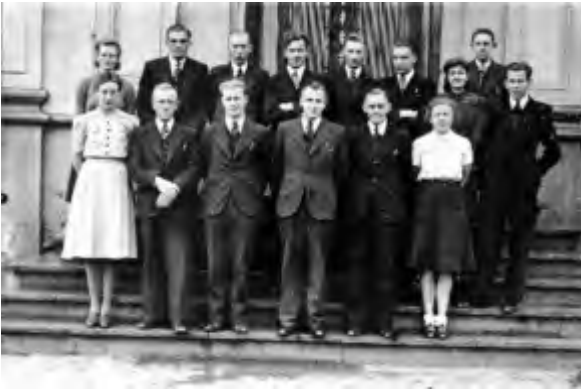
Alle leden van het distribuebureau

Al de volgende morgen "waren de 'Grünen' uit Enschede er al. Ze donderden door het dorp en verhoorden alle ambtenaren op het gemeentehuis. Bij Hakkert deden ze ook huiszoeking. Ze vonden enkele illegale blaadjes en gestencilde nieuwsberichten van de Engelse zender; ze hebben hem meegenomen en overgebracht naar Amersfoort."