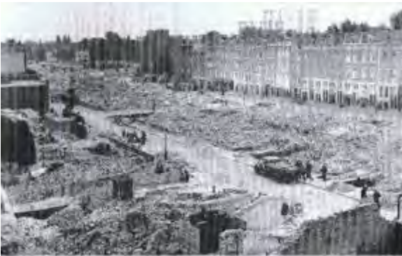
Ergens in deze puinhopen stond ons huis

Dit bombardement werd de aanleiding tot de capitulatie van Nederland en de bezetting door de Duitsers.