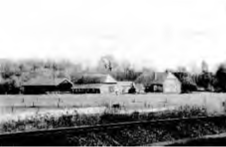
Boerderij “De Meijer”

De gevolgen voor de buurtbewoners waren echter groot. De volgende dag werd de hele omgeving afgezet en zij werden