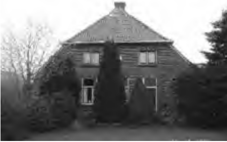
Boerderij “De Hunger”

Reeds in 1947 kon bij “De Hunger” de nieuw gebouwde boerderij, die voor de regeling van de oorlogsschade in aanmerking kwam, in gebruik worden genomen. Omdat bij “De Meijer” alleen het woonhuis en de koestal waren afgebrand en de schöppe (schuur) was blijven staan kon een deel van het vee gestald worden en werd de rest verkocht. Zelf vonden ze eerst onderdak bij Greven (Get Nieland). Daarna werd het kippenhok ingericht waarin ze tot 1952 hebben gewoond. Dit wonen was echter zeer gebrekkig en de veehouderij kon door gebrek aan stalruimte slechts in beperkte mate worden voortgezet. Als gevolg van ambtelijke regelgeving kwamen ze voor geen enkele herbouwing in aanmerking. Dokter Wanrooij en de Stichting 1940-1945 hebben ervoor gezorgd dat er uiteindelijk weer gebouwd kon worden.