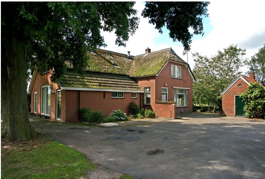
erve Klein Oldenhof