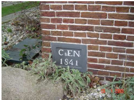
In het huis bevindt zich een steen linksonder in het voorhuis: C & E N 1841 (Cornelis en Engelbert Nagel).

De wagenmakerij werd naderhand opgeheven waarna er achtereenvolgens vele kostgangers onderdak vonden. Thans wordt het bewoond door de familie Klein Velderman-Vruwink.