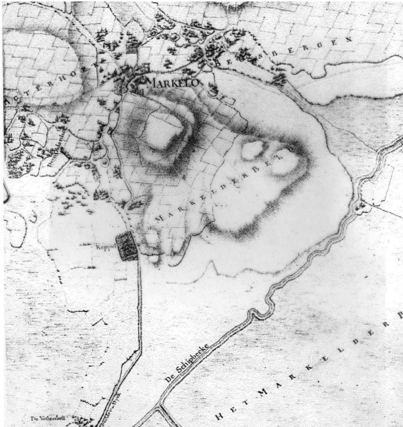
Hottingerkaart ca 1775