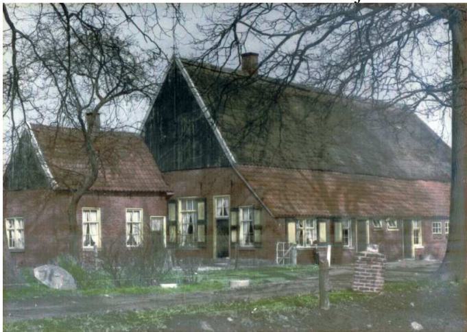
Bouwhuis Olijdam ook Pool genaamd.

“De havezathe is reeds voor vele jaren gesloopt. Ter plaatse waar zij gestaan heeft ziet men thans nog eene verhevenheid en overblijfselen van de fundamenten en in de nabijheid een boerenhofstede welke den naam van Olijdam of Pool heeft”.